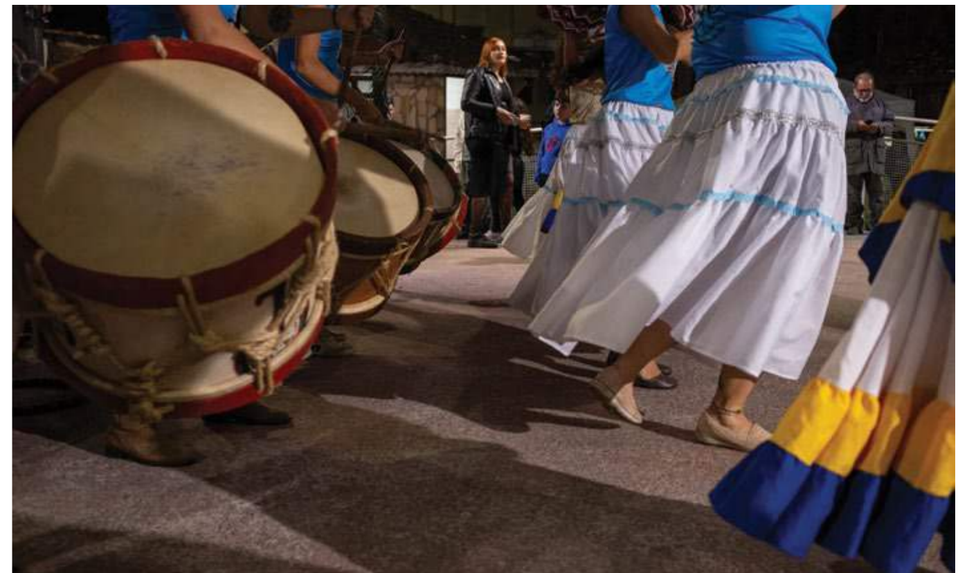
Os tambores marcam o ritmo enquanto as saias giram, transformando a dança em uma celebração visual e sonora. Cananéia (SP), 2024.