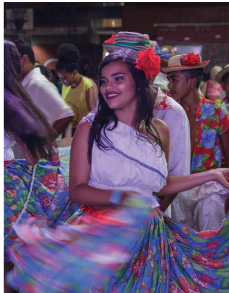
Carimbó é uma dança de roda que combina música, dança e tradição do nordeste do Pará. Belém (PA), 2019.