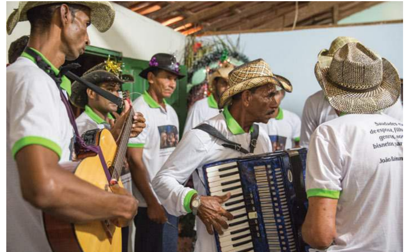
Giro da Folia da Barrinha na comunidade Torrada. Serra Dourada (BA), 2017.