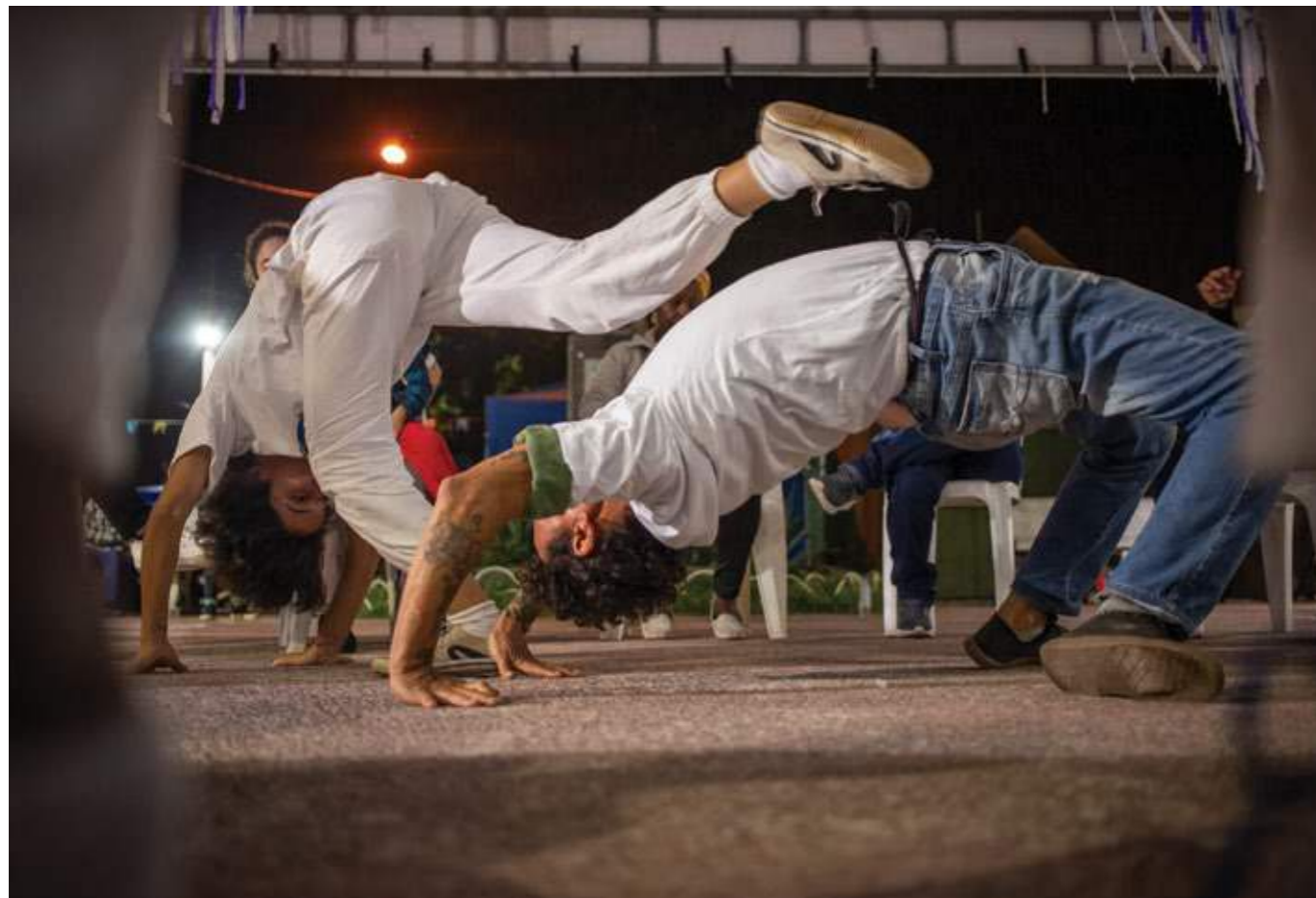
A capoeira ganha vida em um encontro de corpos e movimentos, dançando a história e a resistência. Cananéia (SP), 2024.

O evento não foi apenas uma comemoração, mas também uma homenagem à cultura popular brasileira, reafirmando a importância de manter vivas essas tradições. Cananéia, com sua atmosfera acolhedora, tornou-se o cenário perfeito para celebrar a união, a história e a arte que conectam as pessoas através do tempo e da diversidade cultural.”