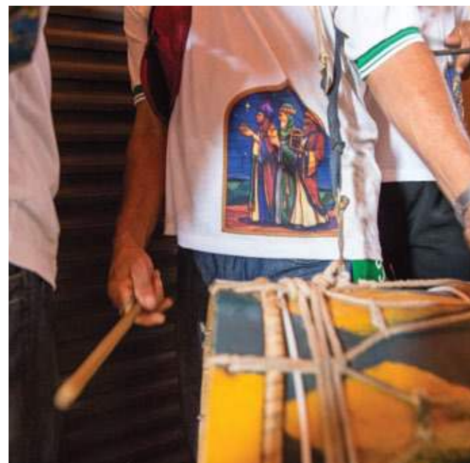
Folião com seu tambor. Santa Maria da Vitória (BA), 2018.

Mais detalhes sobre as propostas podem ser conferidas no Papo Reto, na página 17.