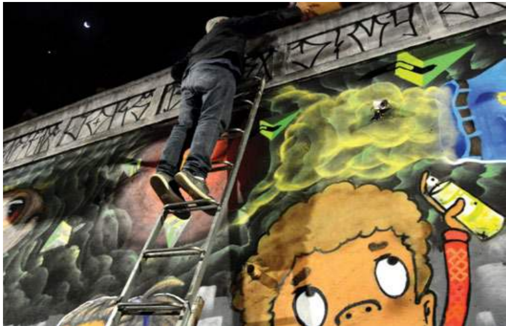
Grafitheiros da Brasilândia no Sarau da Brasa. São Paulo (SP).

É desse sonho compartilhado que nasce o Instituto, “um projeto da comunidade para a comunidade, uma iniciativa local com pensamento global, porque nós queremos que nossa história também seja contada assim como a ‘história da humanidade’ do parque”, enfatiza Marian, que desde 2018 passou a ser apenas voluntária da organização para assumir a chefia do Parque Nacional da Serra da Capivara.