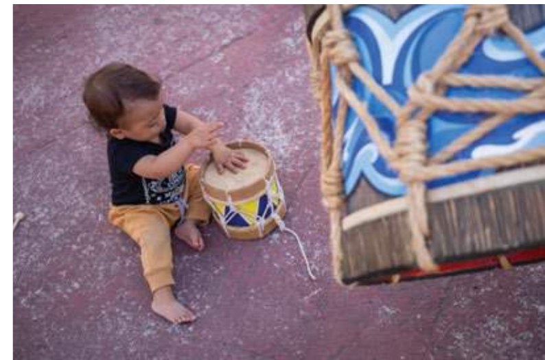
Criança explora o som do tambor, simbolizando a conexão entre gerações e a continuidade das tradições. Cananéia (SP), 2024.

que for pensado para o país. “Temos discutido sobre o tema e tentado influenciar o investimento social privado [ISP]. Estamos sistematizando novas pesquisas, sínteses e evidências sobre a área. Porque viemos de um período de grande desmonte do campo da cultura, para podermos pensar, a partir do campo de ISP, esse fortalecimento.”