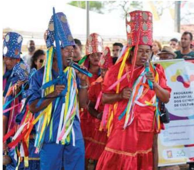
Atividade do Comitê de Cultura de Alagoas na Festa do Meado do Quilombo Lunga, em Taquarana (AL).

Com a mudança no governo federal, o Ministério da Cultura foi recriado. O setor cultural passou a aparecer nos discursos oficiais como uma força importante para a união e a reconstrução do país, lema do atual governo. [Confira uma entrevista exclusiva com a Ministra da Cultura, Margareth Menezes, no Papo Reto, na página 17]