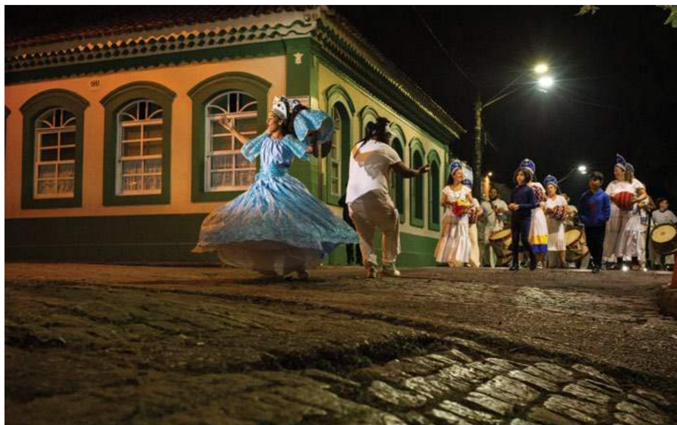
Uma dançarina em traje tradicional roda em meio a um cortejo cultural nas ruas de Cananéia. Cananéia (SP), 2024.