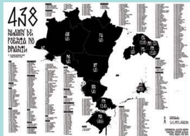
Foto da exposição Gira da Poesia – 15 anos de slam no Brasil no Instituto Tomie Ohtake, de 19 de julho a 8 de setembro de 2024

“E se o que está em jogo é lutar pela paz Sejamos Mandela, sejamos Racionais Pra pensar e cantar, coração em fúria Que é feita de sangue, mas também de sol Solidão e de fé e de dor De irmandade e amor, é por isso que eu vou E eu vou e eu vou...”