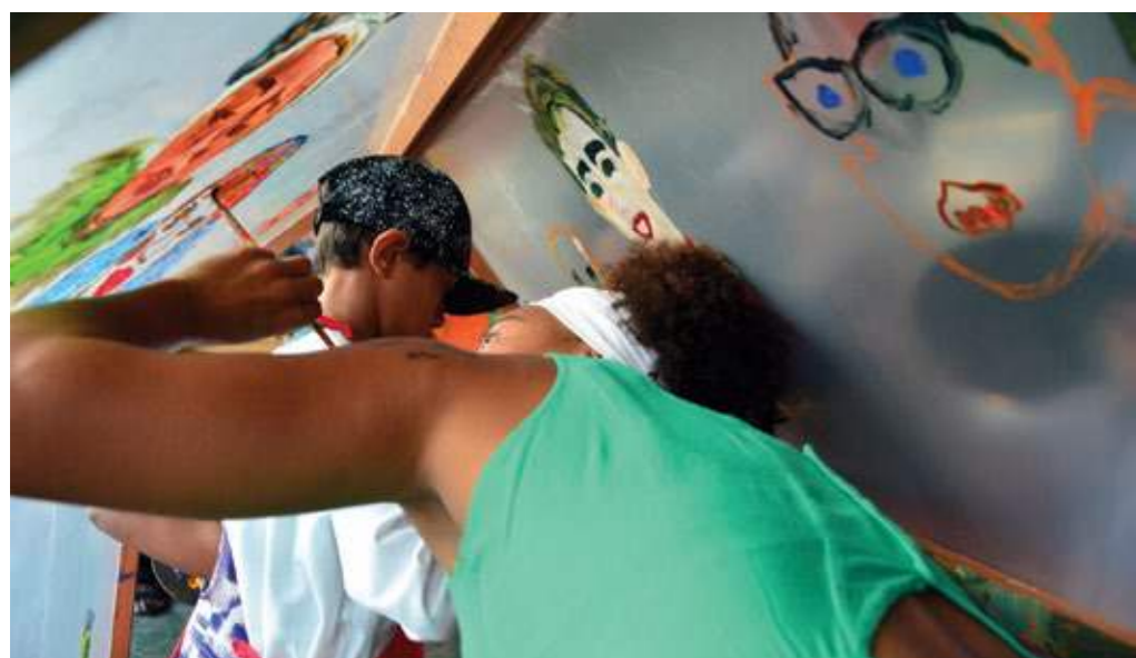
Oficina de Artes no Sarau da Brasa. São Paulo (SP).

Os saraus constroem narrativas, abrem caminhos, fortalecem as lutas, celebram o encontro cultural entre poetas, artistas e moradores do bairro. Estas fotos partilham a memória desses encontros.”