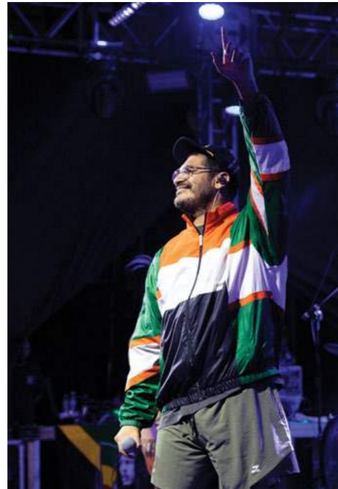
Criolo durante ensaios em São Paulo.

É algo muito pessoal. É como respirar, sobretudo para quem já sofreu na vida, que não quer ver o outro sofrer. Quando algo te machuca, cada um reage de um jeito. Como é transformar tudo isso? É entender que não é legal o jeito que o país trata o que é mais importante, que é o seu povo.”