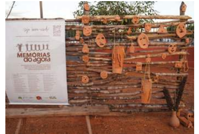
Exposição de peças de arte em argila criadas pelas crianças atendidas pelo IOd'A.