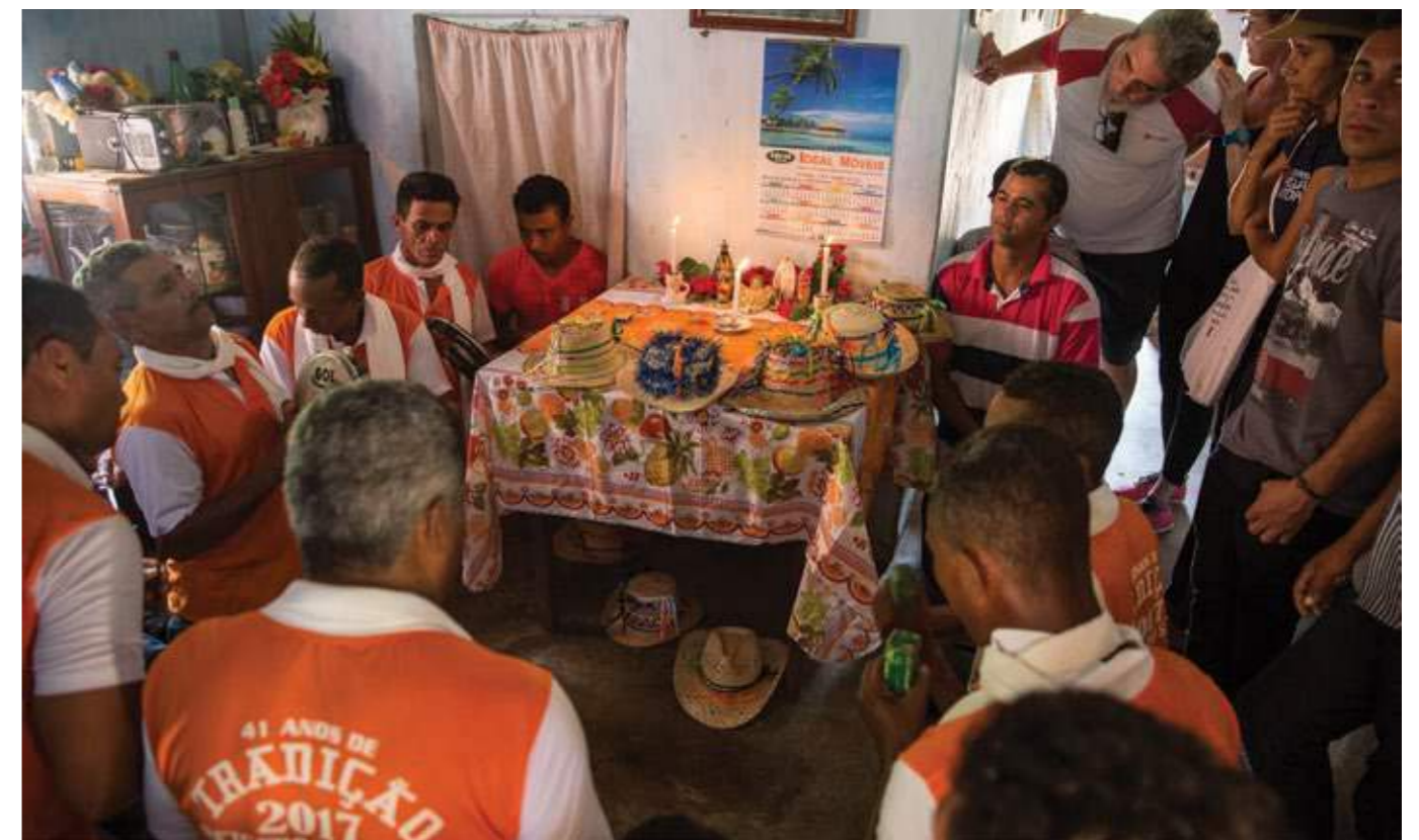
Folia de Reis do Salto passando de casa em casa na comunidade. Correntina (BA), 2018.