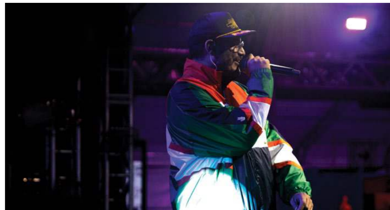
Criolo durante ensaios em São Paulo.