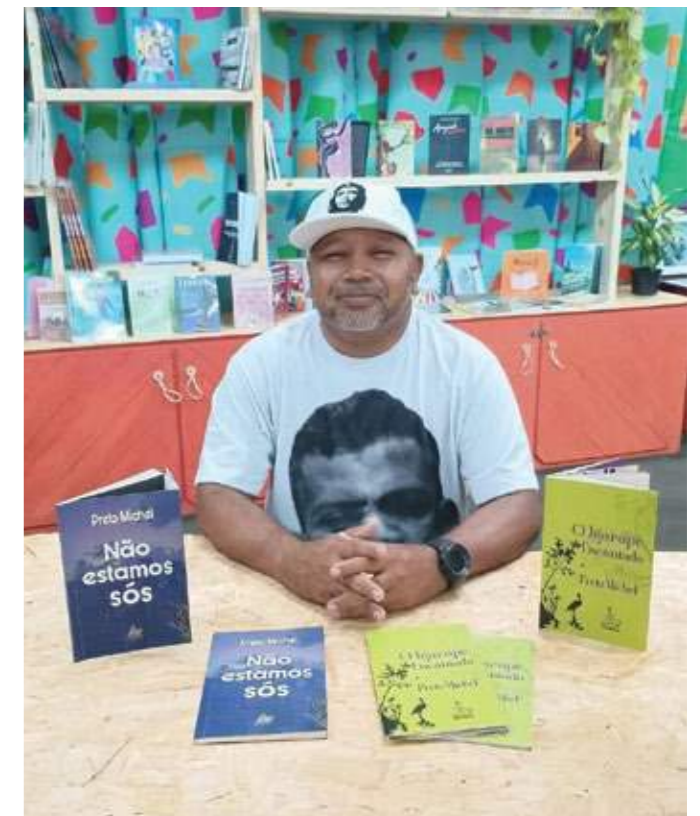
Preto Michel.