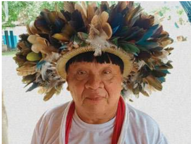
Líder indígena Mopiri Suruí usando cocar tradicional Paiter Suruí e colar vermelho e branco que simbolizam liderança e sabedoria.