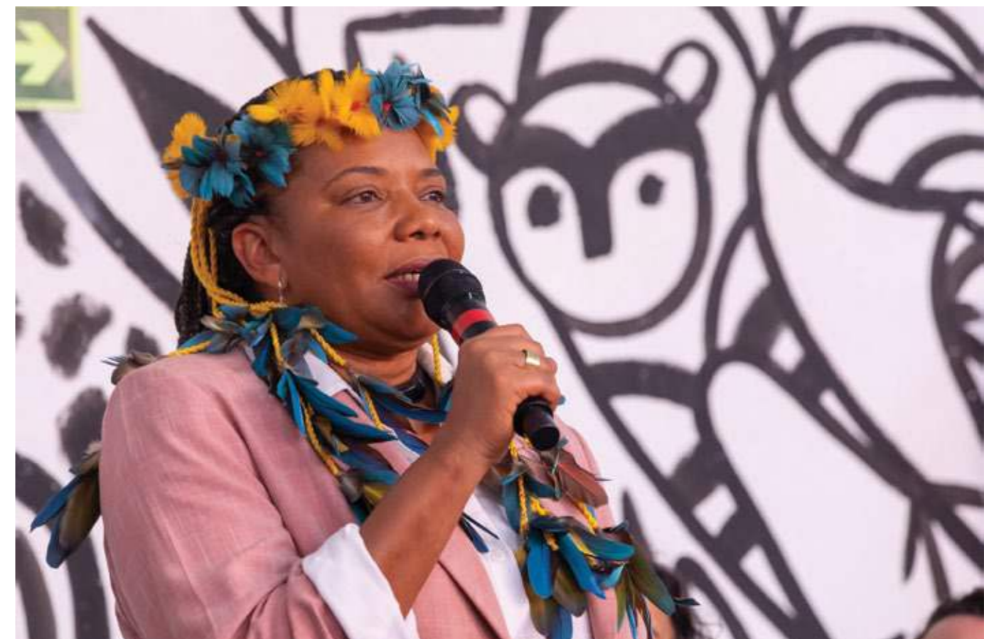
A Ministra da Cultura durante reunião com lideranças e representantes dos Povos Indígenas.

Acreditamos que esse caráter democrático e plural contribua para que o plano possa ser bem acolhido. O Congresso Nacional sabe da importância dele e estaremos acompanhando de perto o processo, fazendo todas as gestões para reforçar a importância desse marco, no intuito de que ele seja aprovado com a devida prioridade.