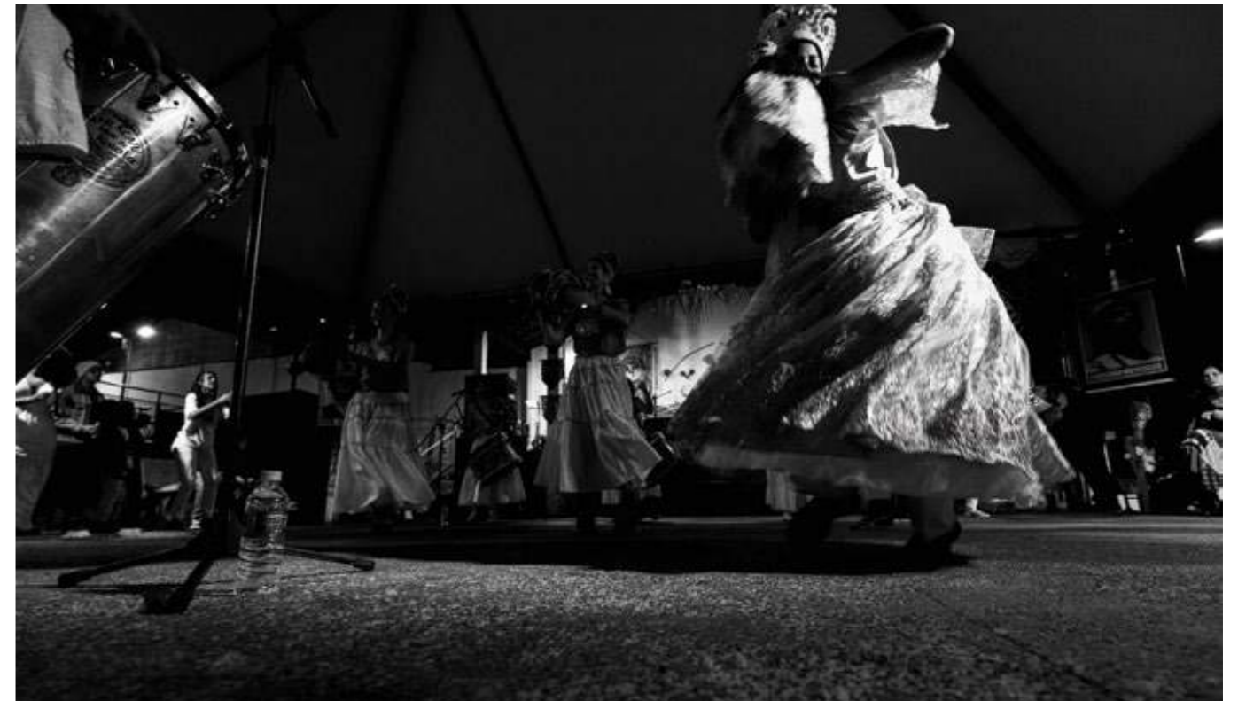
O movimento e a força das danças tradicionais ganham destaque sob as luzes do palco, celebrando a ancestralidade durante o Festival das Culturas Populares e Tradicionais de Cananéia (SP), 2024.