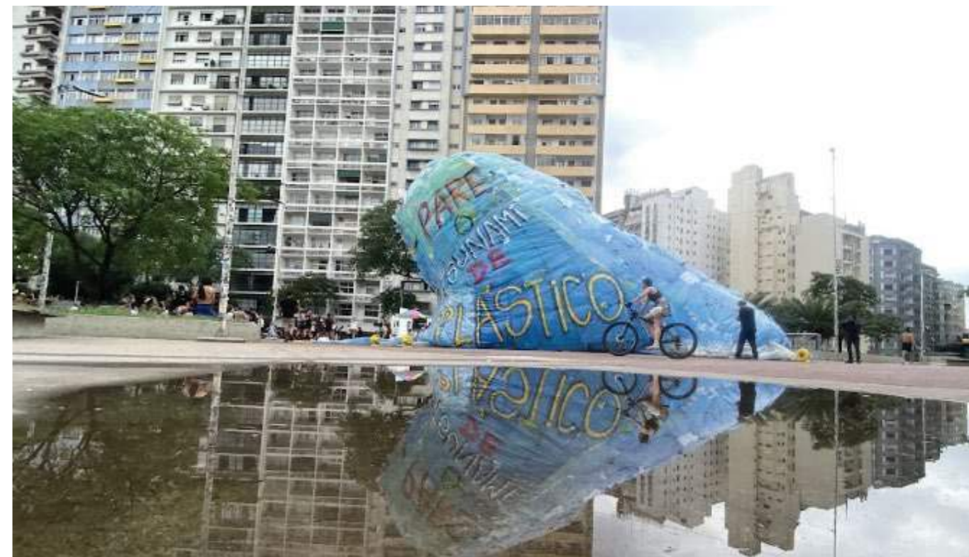
Tsunami inflável feito com mais de 1.100 sacolinhas plásticas em parceria com o Coletivo Flutua.