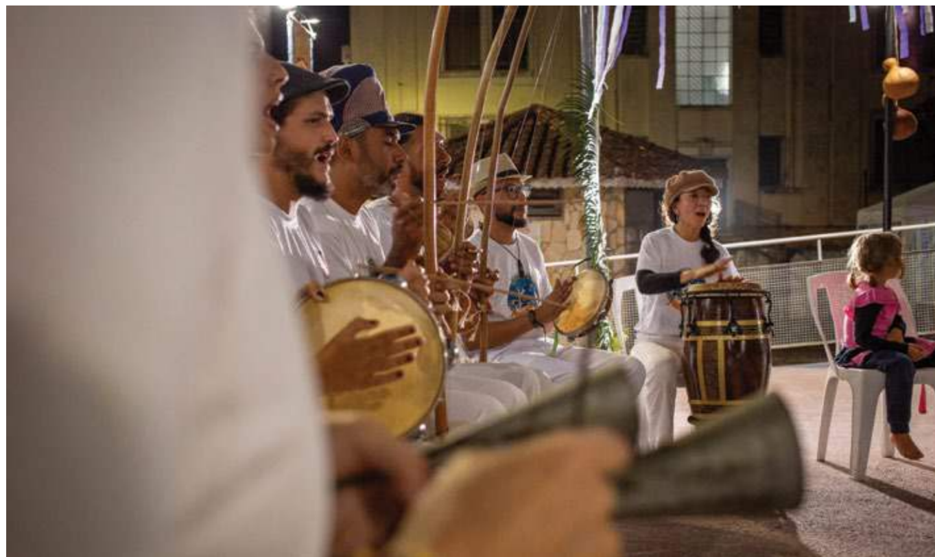
Músicos entoam ritmos tradicionais, unindo vozes e tambores em uma celebração cheia de energia. Cananéia (SP), 2024.