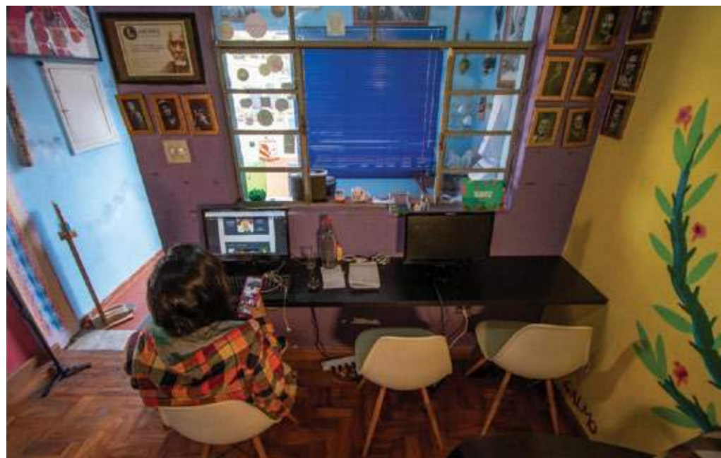
Um dos primeiros coworkings da periferia.