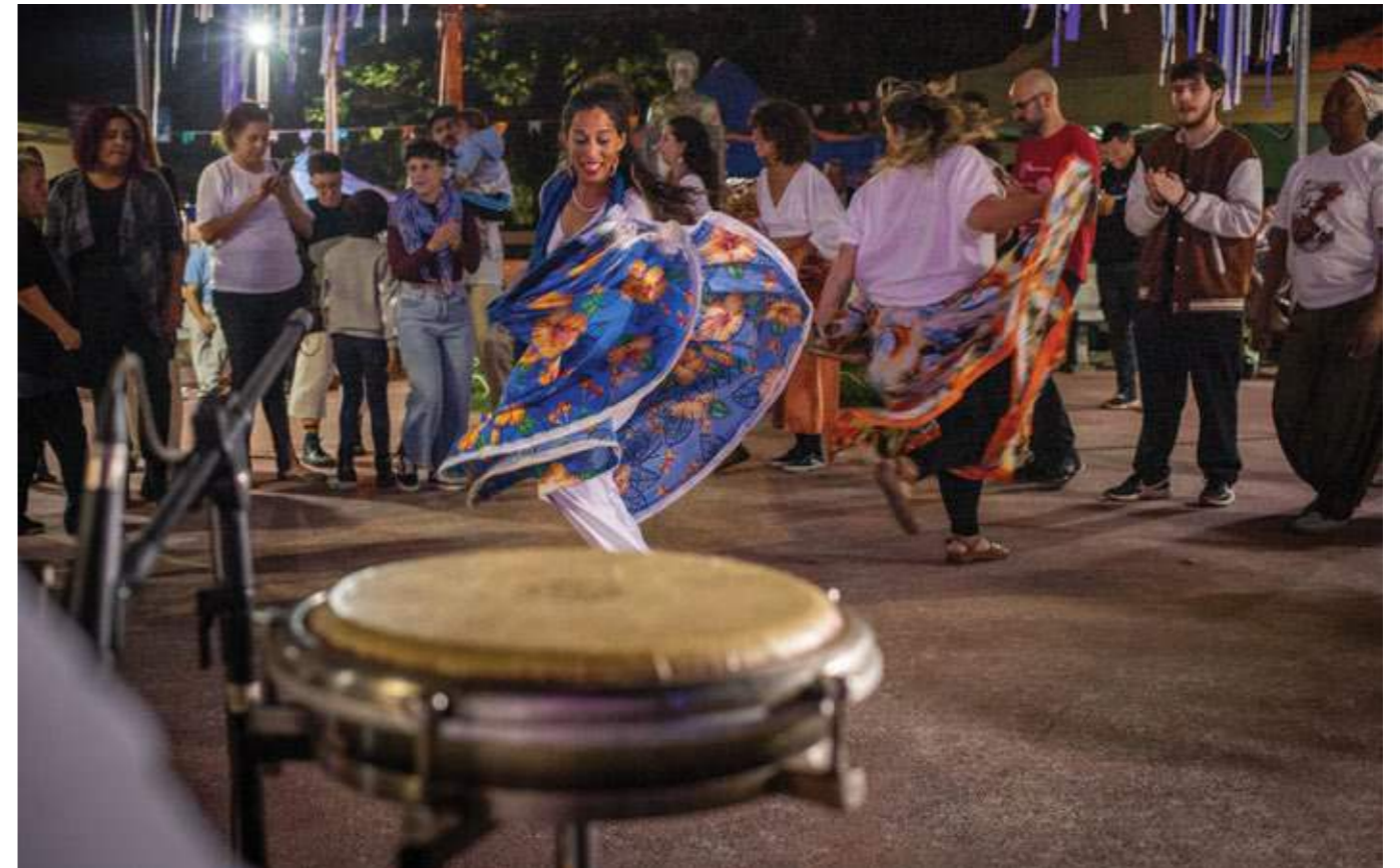
Com um giro vibrante, a dança floresce, conectando tradição e alegria em cada passo. Cananéia (SP), 2024.