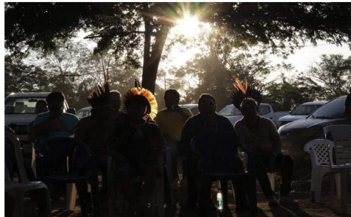
Lideranças indígenas em reunião dentro do território indígena.